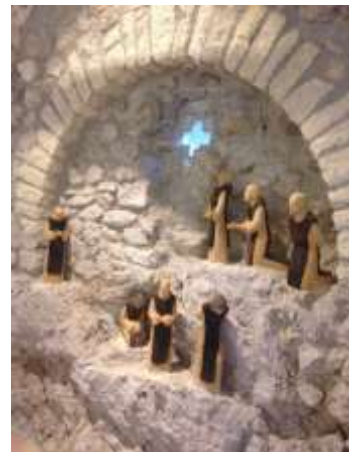
Moines de Tibhirine